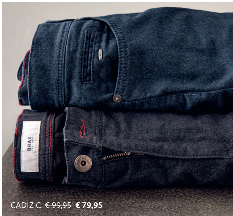
CADIZ C € 99,95 € 79,95