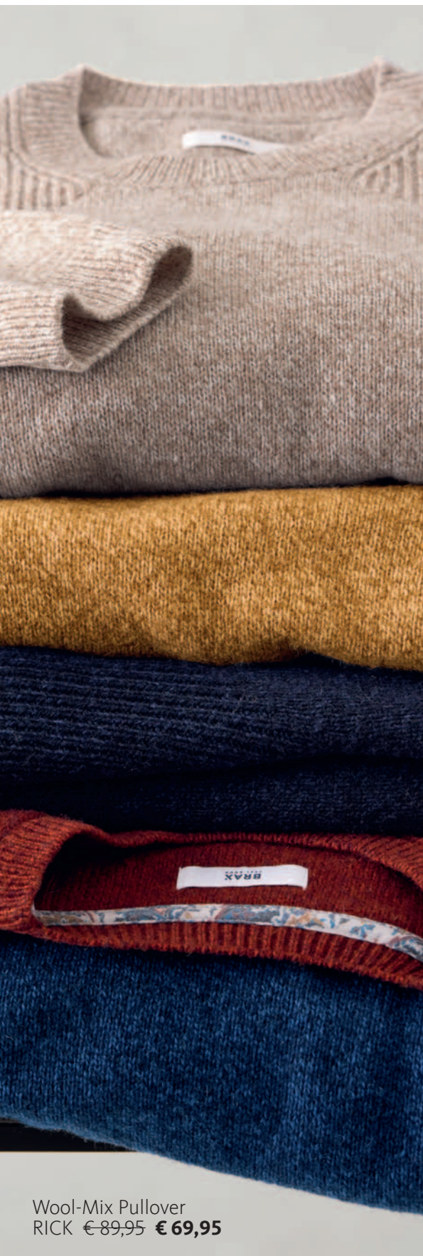
Wool-Mix Pullover RICK € 89,95 € 69,95